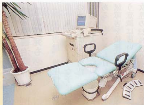
前立腺肥大症の治療に使われる前立腺高温度療法機器。1時間程度の治療で終了する

「50歳代から多くなる前立腺肥大症には、まず薬物療法で対応しています。この治療で効果が得られずQOLの改善が見られない場合は、手術をすすめます。手術は、経尿道的に内視鏡を用いて前立腺を切除する方法が標準的で、1〜2週間程度の入院が必要になりますので、患者さんを総合病院に紹介しています。しか