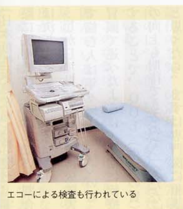
エコーによる検査も行われている